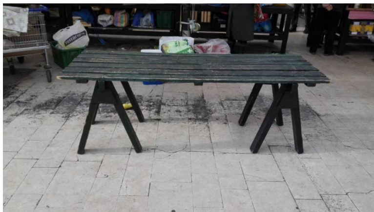
Primjer tradicijskog dubrovačkog štanda je sklopivi banak na zelenoj placi (tržnica) na Gundulićevoj poljani, 200x70 cm.

Štandovi će se koristiti i na drugim manifestacijama koje bi se odvijale u ili ispred Lazareta poput sajma tradicionalnih obrta, gastro sajmova ili predstavljanja lokalnih OPG-ova, a na njima će se prodavati autohtoni proizvodi i suveniri inspirirani kulturnom baštinom.